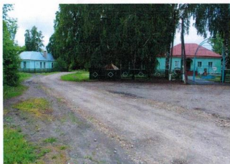
п.Тоновка,ул.Кирова 2а,Кирсановский район,Тамбовская область,393378