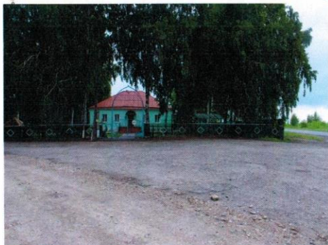
п.Тоновка,ул.Кирова,2а,Кирсановский район,Тамбовская область,393378