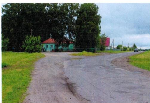
п.Тоновка,ул.Кирова 2а, Кирсановский район, Тамбовская область, 393378