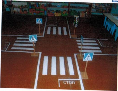
Фото на странице: 1